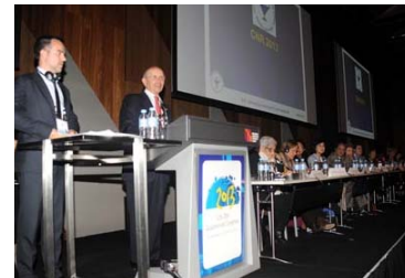
La elección de la ciudad catalana se hizo pública durante el congreso del CIE en Melbourne