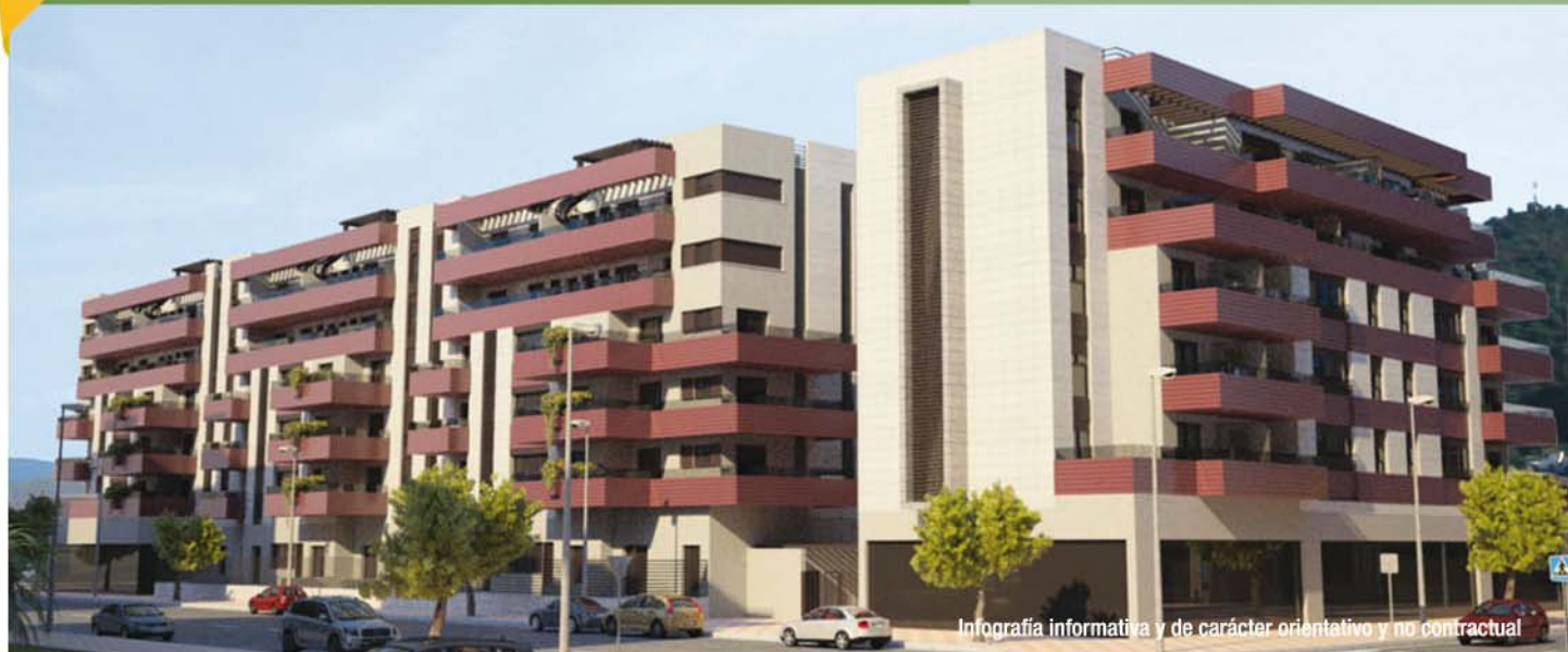
Infografía informativa y de carácter orientativo y no contractual

PRECIOS EXCLUSIVOS PARA COLEGIADOS DE ENFERMERÍA Y FAMILIARES