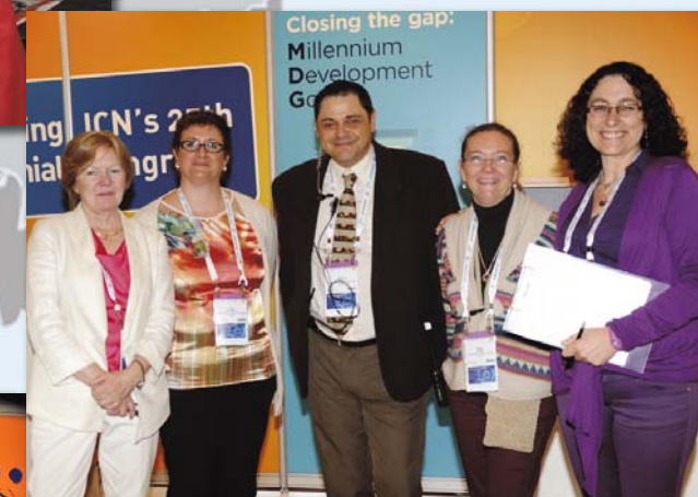
El congreso cuadrienal celebrado en Melbourne ha sido fruto del esfuerzo y dedicación del CIE y todo su personal, que se trasladó casi al completo hasta la ciudad australiana durante los días del evento