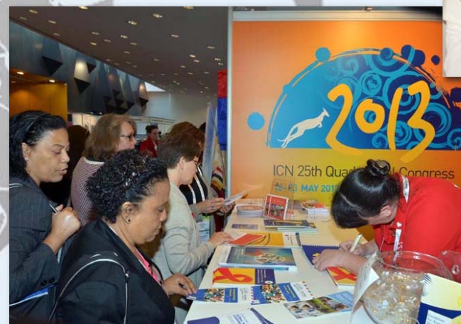
El propio recinto del congreso acogió también una exposición comercial en la que han estado representadas un total de 50 organizaciones de diversos países, incluyendo universidades, ministerios de sanidad, organizaciones de enfermería, editoriales y compañías farmacéuticas