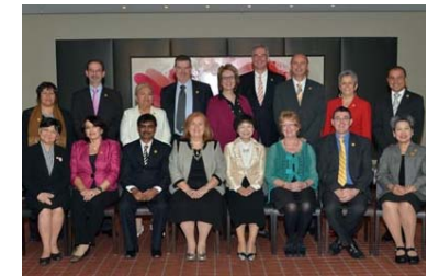
Durante el congreso de Australia se produjo el relevo en la presidencia y la junta directiva del CIE