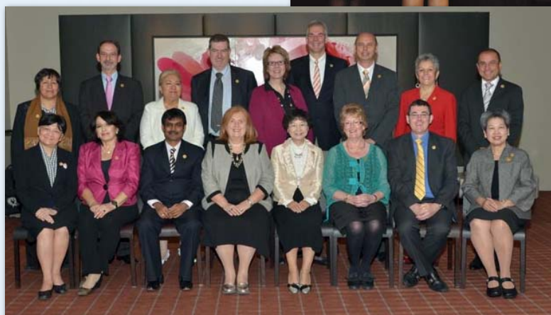
La elección de la nueva presidenta del CIE y su junta directiva tuvo lugar días antes del congreso, en el encuentro del Consejo de Representantes Nacionales (CRN), y se anunció oficialmente el pasado 19 de mayo