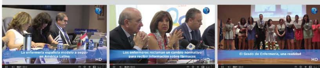
Las plataformas de información y comunicación, tema estrella del encuentro iberoamericano de enfermería