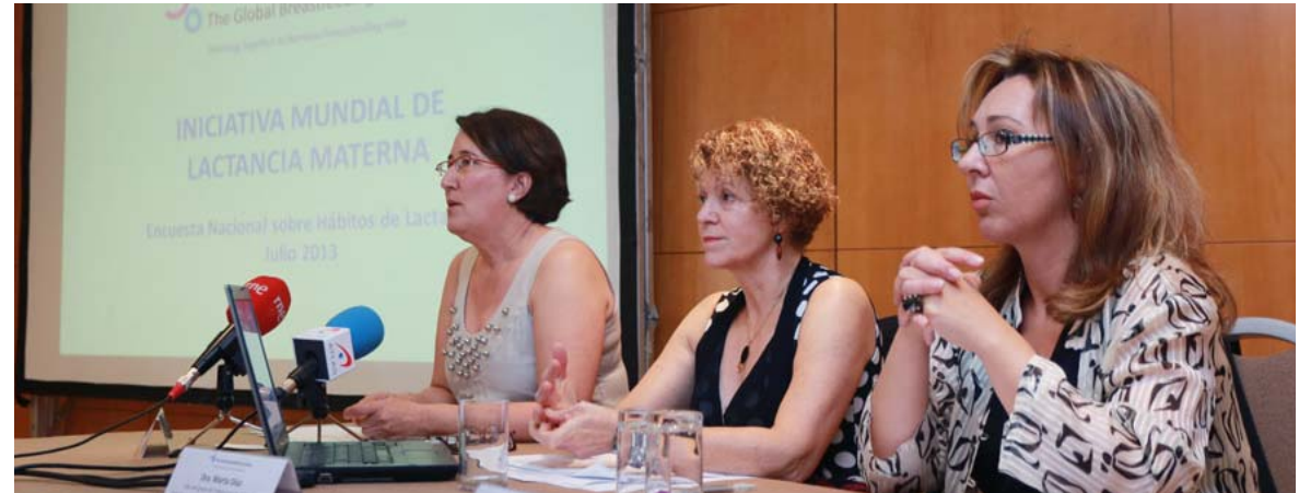
Presentación de la I Encuesta Nacional sobre Hábitos de Lactancia

En este sentido es imprescindible destacar el papel de la matrona para