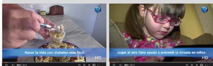
Conociendo DiaBalance, un nuevo aliado ante la diabetes