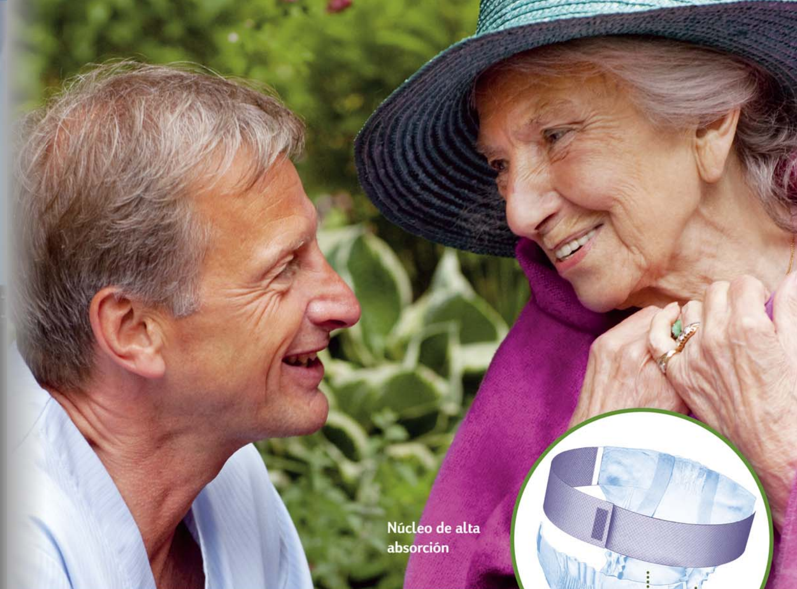
Núcleo de alta absorción