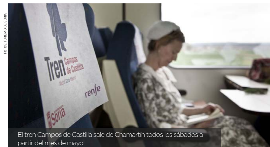
El tren Campos de Castilla sale de Chamartín todos los sábados a partir del mes de mayo

Todavía se conserva el aula donde Machado impartió clases