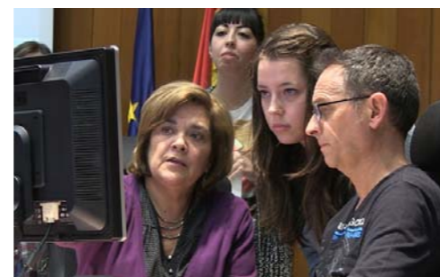
La especialidad más demandada ha sido matrona

A las puertas del Ministerio, y con una sonrisa de oreja a oreja, familiares y amigos esperaban entusiasmados a sus más allegados, que habían logrado cumplir uno de sus sueños: ser enfermeros especialistas.