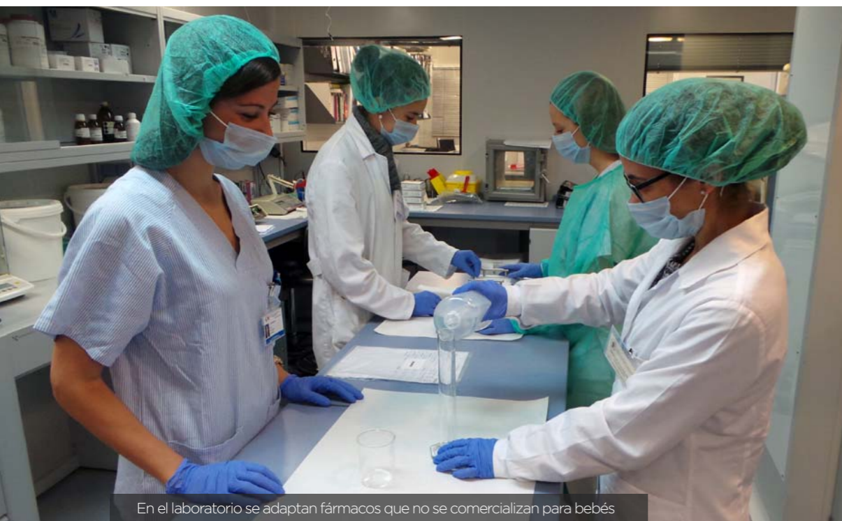
En el laboratorio se adaptan fármacos que no se comercializan para bebés