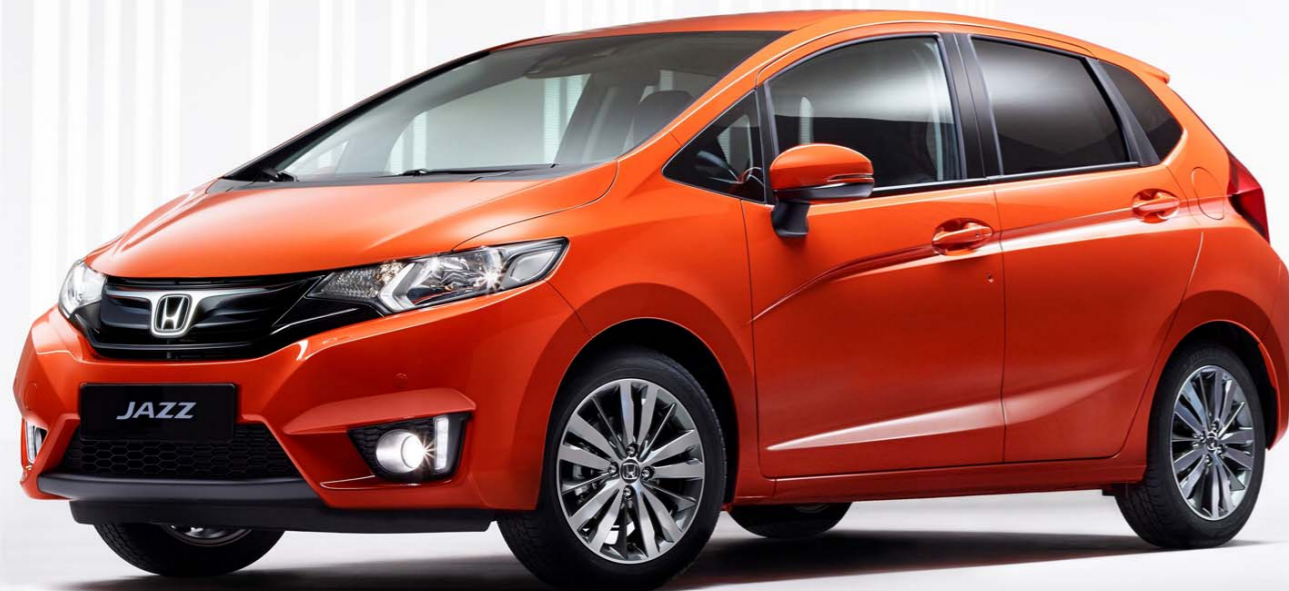
El frontal se ha adecuado a los gustos actuales

Tecnología aparte, en un vehículo de este tipo la prioridad es siempre el espacio. Frente al modelo actual, el