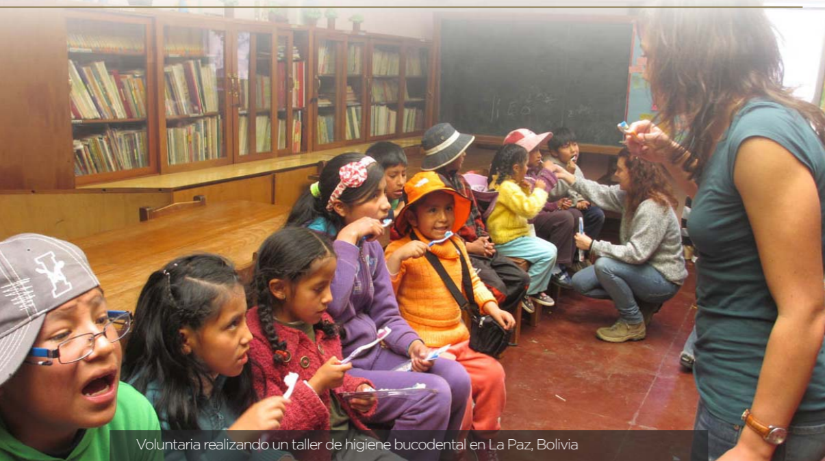
Voluntaria realizando un taller de higiene bucodental en La Paz, Bolivia