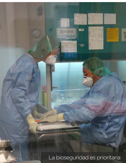
La bioseguridad es prioritaria

del servicio de farmacia para asegurarnos al 100% de que todas nuestras mezclas de tratamientos oncológicos y de nutriciones parenterales lleguen perfectas al enfermo". Y es que, tal y como afirman en el servicio, "muchas gente piensa que si la enfermera de farmacia se equivoca no hay ningún problema, y realmente el pilar fundamental para este hospital es la enfermera de farmacia. Si nos equivocamos en un tratamiento oncológico, por mucho que la enfermera del hospital de día se lo administre bien, la dosis va mal desde aquí. Por eso —explica Moreno— es muy importante la labor que hacemos de concentración, de estar preparadas, de tener una formación necesaria. Todo para que al paciente le llegue en correctas condiciones cuando sale de la farmacia".