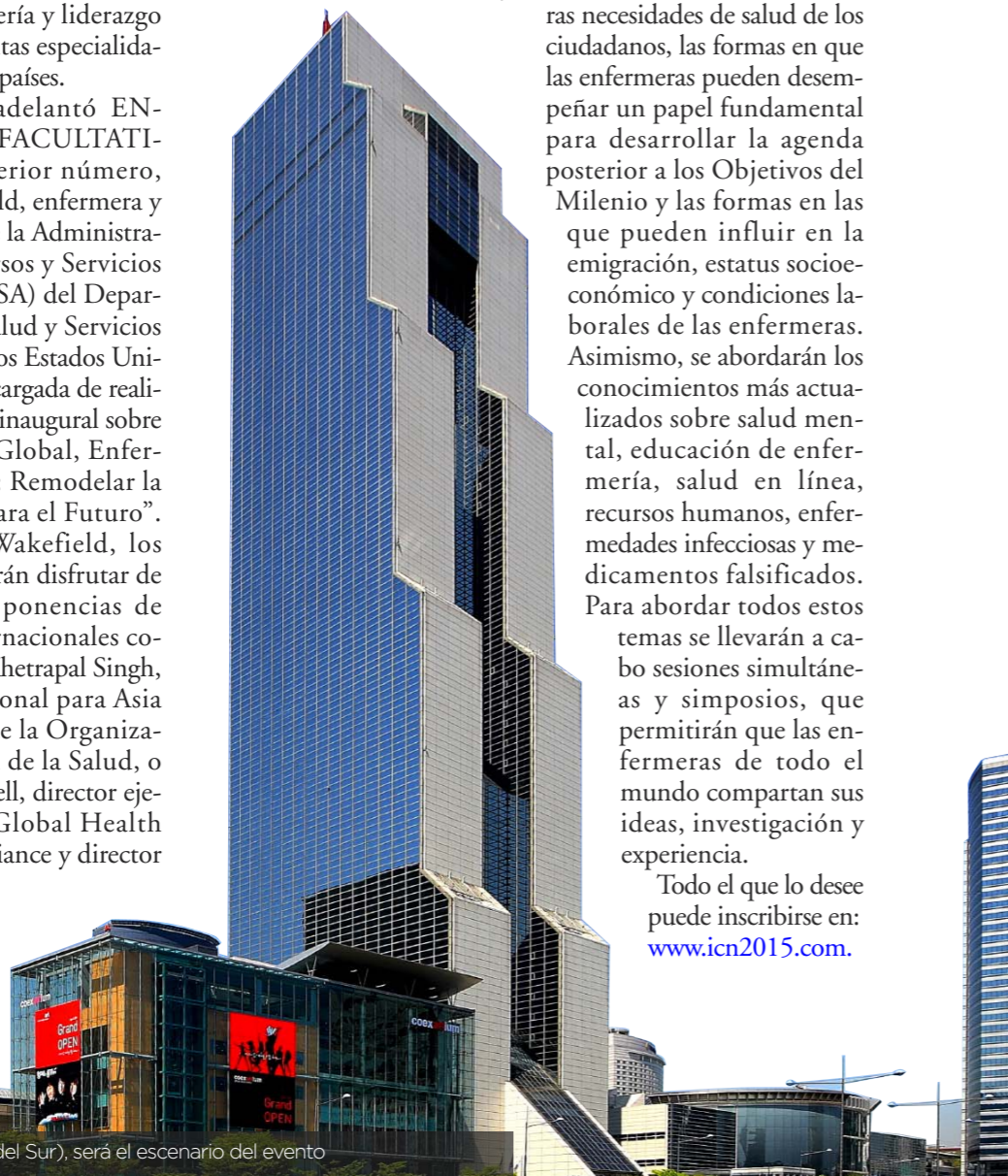
Seúl (Corea del Sur), será el escenario del evento

Todo el que lo desee puede inscribirse en: www.icn2015.com .