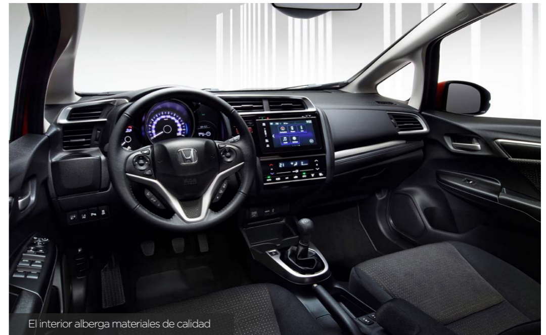
El interior alberga materiales de calidad

como la entrada de gran cantidad de luz en el habitáculo.