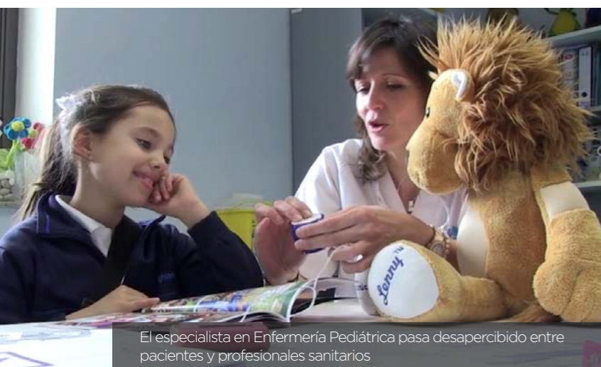
El especialista en Enfermería Pediátrica pasa desapercibido entre pacientes y profesionales sanitarios