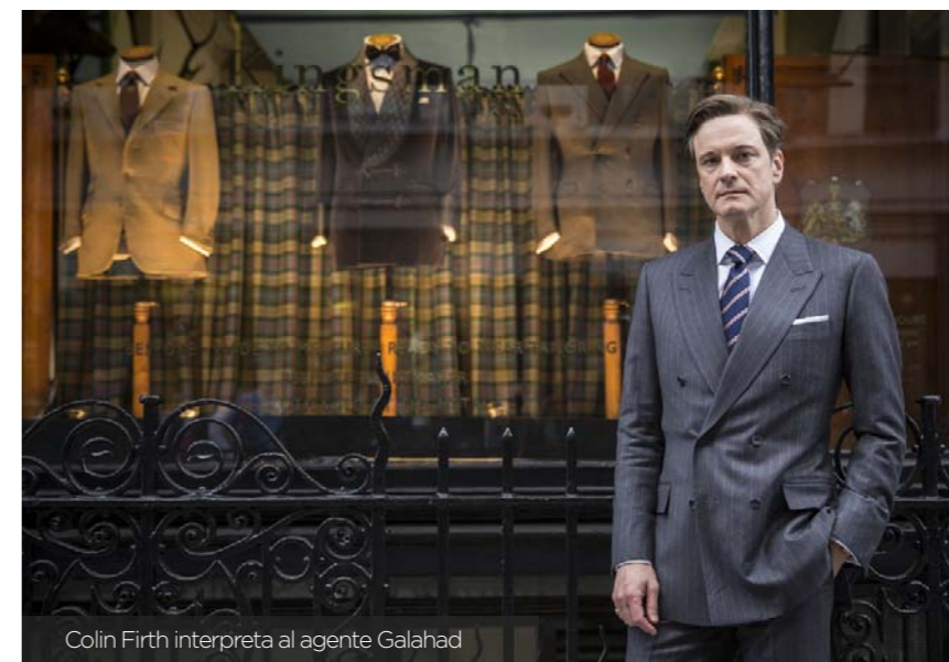
Colin Firth interpreta al agente Galahad

Apoyada en la ironía de su relato y en la originalidad en la ejecución de sus secuencias de acción (la frenética escena de la iglesia resulta epatante), Kingsman no da tregua alguna al espectador que asiste entre atónito y deslumbrado a cada nueva pirueta visual. Y, además, se permite el lujo de bromear acerca de los clichés de las pelis de espías: con los malvados típicos, las tretas imposibles de los espías y su arsenal de gadgets armamentísticos. Todo al servicio de una propuesta genial, subversiva, sangrienta y tremendamente entretenida.