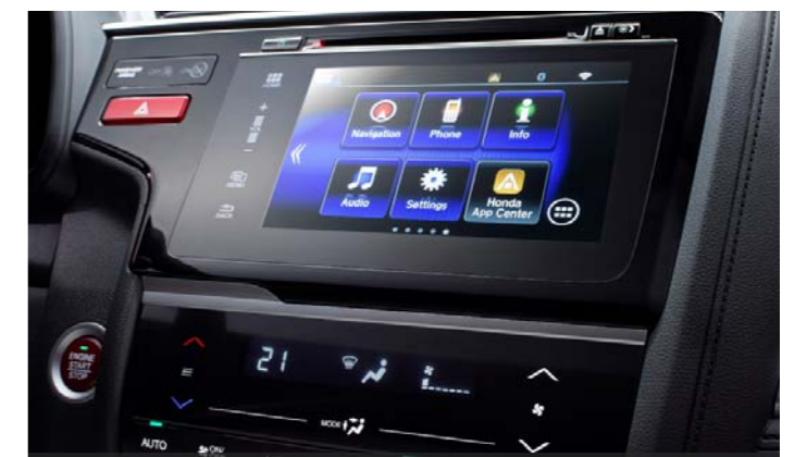
Con la pantalla táctil se pueden instalar apps

Una pantalla táctil permite acceder a Internet