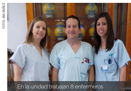
En la unidad trabajan 8 enfermeros