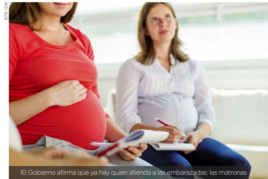
El Gobierno afirma que ya hay quien atienda a las embarazadas: las matronas