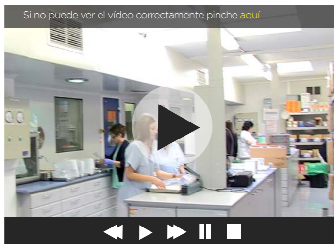
Si no puede ver el vídeo correctamente pinche aquí