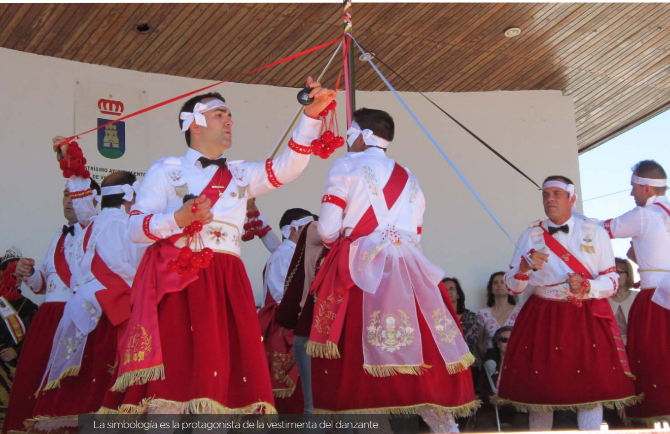
La simbología es la protagonista de la vestimenta del danzante