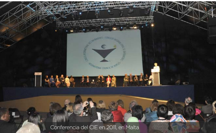
Conferencia del CIE en 2011, en Malta

En poco menos de dos meses, enfermeros y enfermeras de todo el mundo se reunirán en Seúl (Corea) para celebrar la Conferencia del Consejo Internacional de Enfermería , que se llevará a cabo desde el 19 hasta el 23 de junio. El primer día, desde las 9.00 hasta las 13.30 se realizará la asamblea de estudiantes de enfermería.