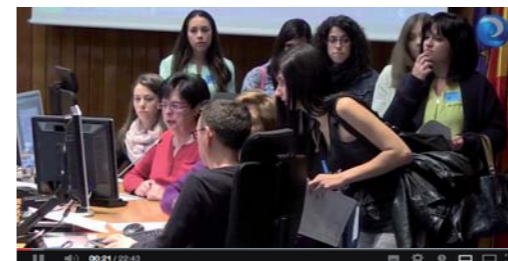
Las mejores enfermeras del EIR quieren ser matronas

El informativo de Canal Enfermero NOTICIA a NOTICIA