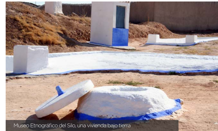
Museo Etnográfico del Silo, una vivienda bajo tierra

La procesión es el momento más esperado por todos. Durante las más de dos horas que