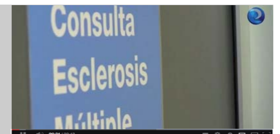
Una enfermera de seguimiento para pacientes con esclerosis múltiple

Diario Enfermero, toda la información sanitaria y profesional a golpe de clic