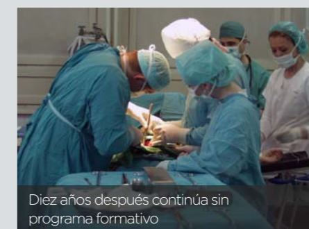
Diez años después continúa sin programa formativo

Aun así, es optimista al afirmar que, si se aprueba el programa formativo, “podría formar parte de la próxima convocatoria EIR”. Para más adelante, y sin horizonte temporal, quedaría “el desarrollo de las tres áreas de capacitación específica que se definieron: cuidados periquirúrgicos y periintervencionistas; cuidados a pacientes crónicos complejos; y cuidados a pacientes críticos y de urgencias y emergencias”, finaliza Gómez.