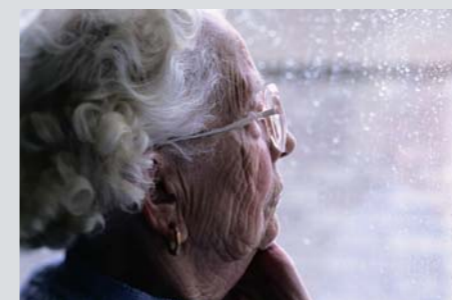
Sólo cuatro autonomías han vinculado la especialidad al puesto de trabajo