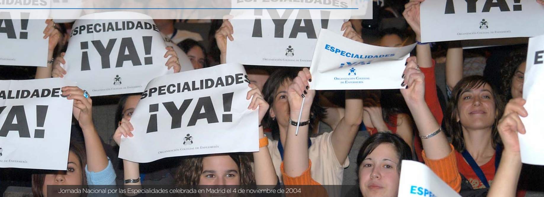
Jornada Nacional por las Especialidades celebrada en Madrid el 4 de noviembre de 2004