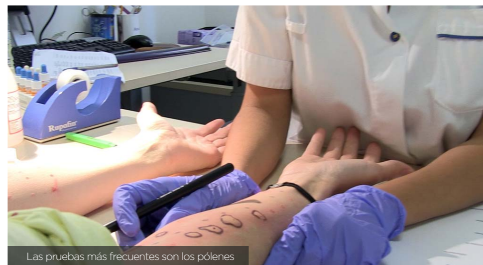
Las pruebas más frecuentes son los pólenes

Castro destaca que, por lo general, en la unidad se trabaja bastante en equipo y todas las semanas las enfermeras se cambian de consulta para ir variando y que no se les haga