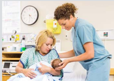
Las unidades docentes antes tenían autonomía