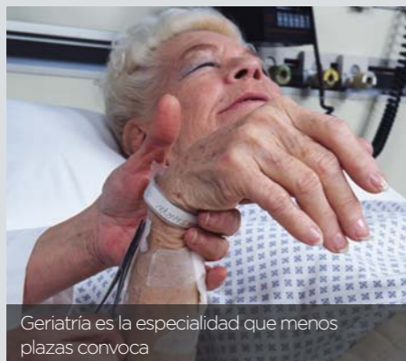
Geriatría es la especialidad que menos plazas convoca

Eso es lo que todo el mundo recuerda de esta especialidad en estos diez años. Y es que la primera prueba de evaluación de la competencia para el acceso excepcional al título fue muy controvertida: después de años esperando esta oportunidad y meses preparándola, los miles de enfermeros que se presentaron a la primera de las dos convocatorias, en octubre de 2013, se encontraron con 56 preguntas anuladas, pues nada tenían que ver con el temario que se había aprobado tres años antes y apenas un 15% de los candidatos aprobó, a pesar de tener una dilatada experiencia y formación en geriatría.