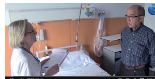
Información y atención personalizada para disminuir la ansiedad prequirúrgica