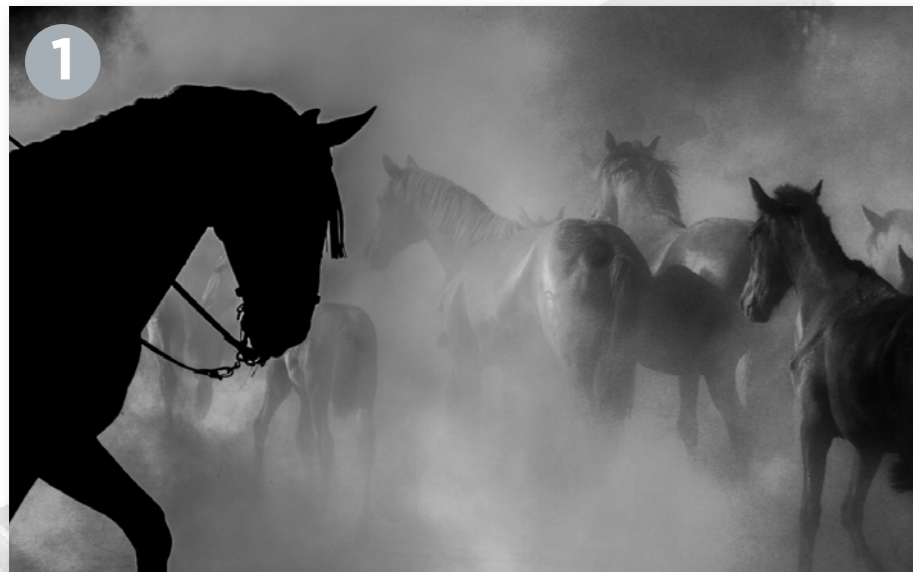
"Domado y salvajes" Antonio José Alcalde Pérez. Huelva