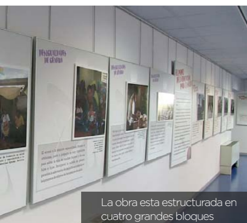
La obra está estructurada en cuatro grandes bloques