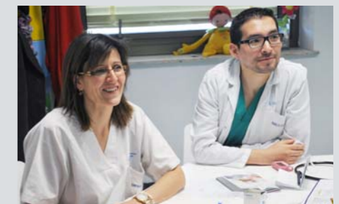
Hay 9.000 especialistas en Enfermería del Trabajo