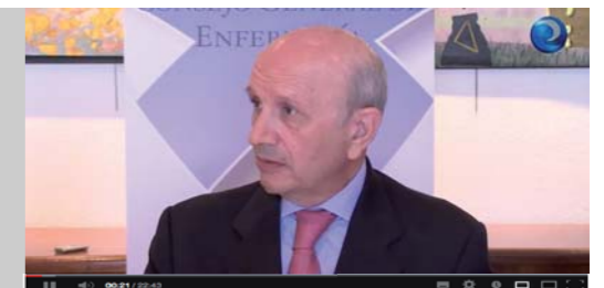
El Consejo General de Enfermería anuncia acciones legales contra el Consejo de Médicos por sus ofensas a la profesión