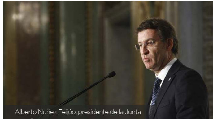
Alberto Núñez Feijóo, presidente de la Junta

De estas, 80 plazas son de enfermería; seis de matronas, seis de fisioterapeutas, 60 de auxiliares de enfermería, y 26