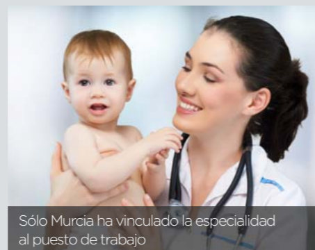
Sólo Murcia ha vinculado la especialidad al puesto de trabajo

Herederas de la antigua especialidad de pediatría y puericultura, por la vía directa 2.554 enfermeras lograron la expedición de su título de especialistas. Otras 14.621 están pendientes de realizar la prueba de evaluación para obtenerlo, un “examen que posiblemente se realizará en el mes de octubre de este año”, finaliza Pedraza.