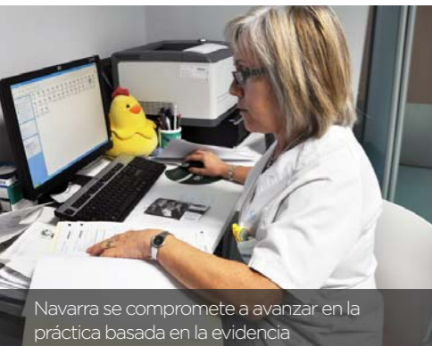
Navarra se compromete a avanzar en la práctica basada en la evidencia

Después de un proceso de competencia y evaluación entre diversos aspirantes, Navarra ha sido seleccionada para formar parte durante el periodo 2015-2017 del Proyecto de Implantación de Guías de Buenas Prácticas en Centros