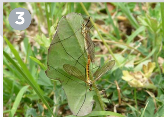
"Ciclo de vida" Dolores Marín Ortega. Santander