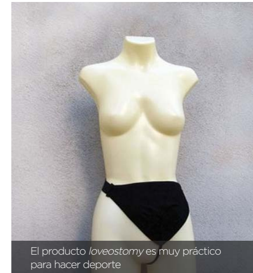
El producto loveostomy es muy práctico para hacer deporte

para la investigación de estas patologías”, explica.