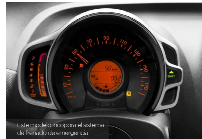
Este modelo incorpora el sistema de frenado de emergencia

Gracias a un sensor láser de corto alcance situado en la parte superior del parabrisas, detecta obstáculos o vehículos en movimiento que circulen en el mismo sentido. "Active City Break" funciona a velocidades inferiores a 30 km/h y permite reducir las colisiones. Si el conductor no interviene en situaciones de peligro, activa automáticamente el frenado. Además, emite avisos ante cambios involuntarios de carril.