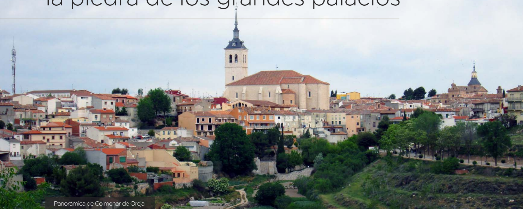
Panorámica de Colmenar de Oreja