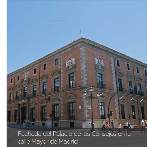
Fachada del Palacio de los Consejos en la calle Mayor de Madrid

Consejo de Estado. Ahora se abre un proceso, que podría demorarse uno o dos meses, cuyo siguiente paso sería la vuelta del texto al Ministerio de Sanidad para valorar si incorpora las valoraciones, correcciones y aportaciones del Consejo de Estado. Aunque el informe de este organismo no es vinculante, si es posible que se incorporen consideraciones de tipo técnico o de contenido. Después, Sanidad llevará el texto al Consejo de Ministros para su aprobación. El presidente de los enfermeros ha expresado su moderada satisfacción ante “un paso que nos deja un poco más cerca de que se haga realidad y se tramite de una vez esta reivin-