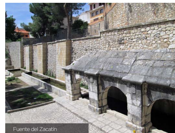
Fuente del Zacatín

La iglesia de Santa María la Mayor y la Ermita del Cristo son, tras la plaza, los dos monumentos más representativos de la localidad. La 'traída' en andas del Santísimo Cristo del Humilladero y de la Virgen del Pilar, desde la ermita hasta la iglesia, da comienzo a la semana grande de Colmenar de Oreja, en la que se celebran sus fiestas patronales —principios de mayo—. Esta primera procesión sirve para iniciar en la iglesia la celebración de la novena, que concluye con la llevada de nuevo de las dos figuras hasta la ermita, esta vez sobre una carroza. Sin duda, este día es el más esperado del año por los colmenaretes, que en su mayoría siguen la procesión por el paseo del Cristo para dar por terminadas las fiestas con una traca final.