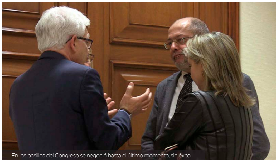
En los pasillos del Congreso se negoció hasta el último momento, sin éxito