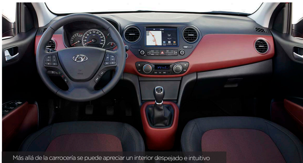
Más allá de la carrocería se puede apreciar un interior despejado e intuitivo

Y como no podía ser de otra manera el nuevo i30 cumple con las normas europeas de seguridad más exigentes: sistema autónomo de frenado de emergencia con aviso de colisión frontal, control de cruceo inteligente, detección de ángulo muerto, alerta de tráfico trasero, sistema de alerta por cambio involuntario de carril, función de información del límite de velocidad y asistencia para luz de carretera. Una novedad en la gama de Hyundai es el sistema de detección de fatiga de conductor (DAA), lo que aporta al i30 todos los elementos de seguridad activa convirtiéndolo en el vehículo con el paquete de seguridad más avanzado.