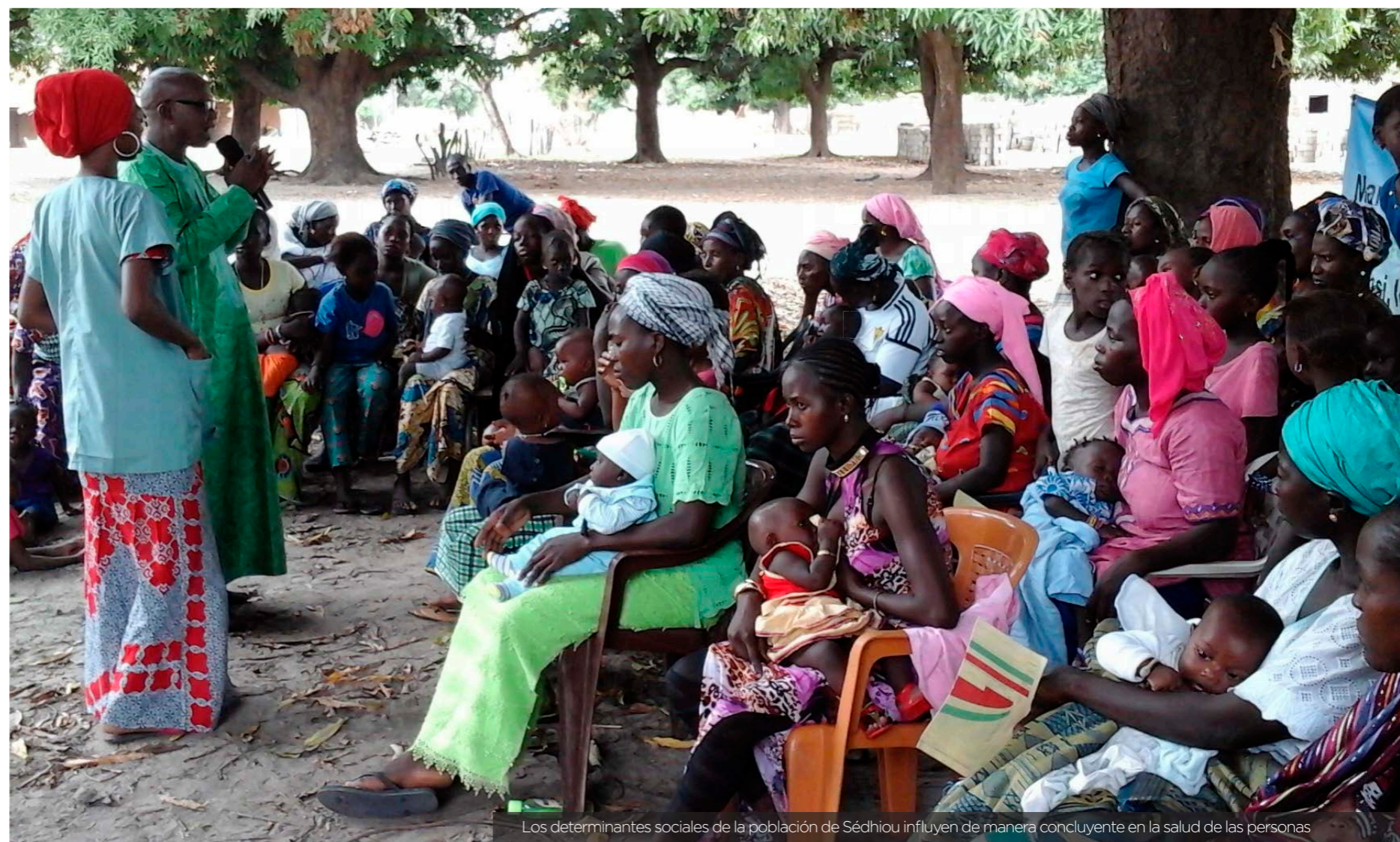
Los determinantes sociales de la población de Sédhiou influyen de manera concluyente en la salud de las personas

Tras esta formación, las Badienou Gox han conseguido sensibilizar a las mujeres de su comunidad y a todo su entorno familiar en las cuestiones más importantes relacionadas con la identificación de los signos de riesgo durante el embarazo, el parto y el postparto, así como la importancia de la planificación familiar y los cuidados imprescindibles al recién nacido. Para