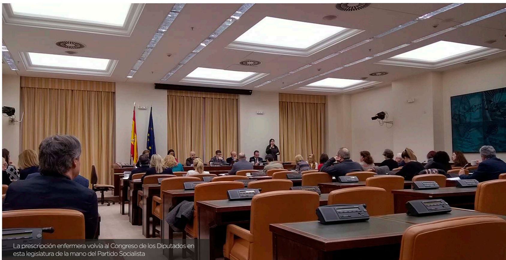
La prescripción enfermera volvió al Congreso de los Diputados en esta legislatura de la mano del Partido Socialista

Real Decreto del Partido Popular, los grupos parlamentarios de Ciudadanos, Unidos Podemos y Esquerra Republicana habían presentado una enmienda conjunta a la propuesta socialista por la que pedían modificar la ley del medicamento.