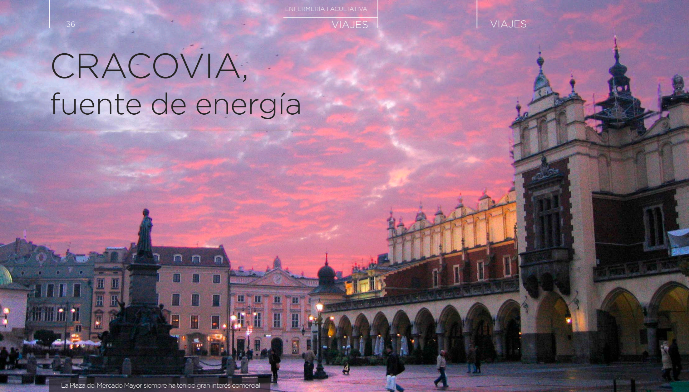
La Plaza del Mercado Mayor siempre ha tenido gran interés comercial